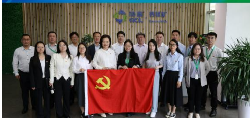
协鑫能科“走基地、看变化、聚力量”主题党日+“脚印工程”企业文化活动

脚印工程是协鑫能科近年来长期开展的，一项以“重温创业路，拥抱新时代”为特色主题的企业文化活动中。通过深入产业项目，既帮助新员工了解协鑫的创业历程和文化精神，也引导老员工开拓视野，升级知识结